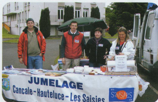
Vente de beaufort sur le marché de Cancale

Une soirée savoyarde est en cours de préparation pour octobre 2006. Il semble que la formule du repas dansant soit retenue. Ceux qui souhaiteront venir déguster une spécialité montagnarde seront les bienvenus. Nos amis savoyards seront peut être même de la partie.